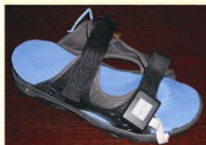
Figure 3. Exemple de réalisation